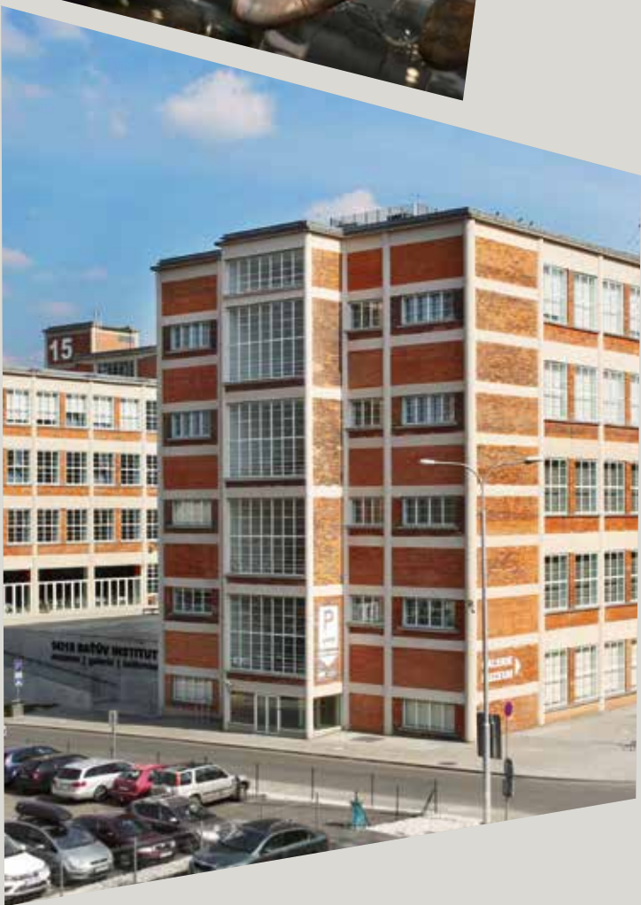
Obrázek: 14|15 BAŤŮV INSTITUT, 2019