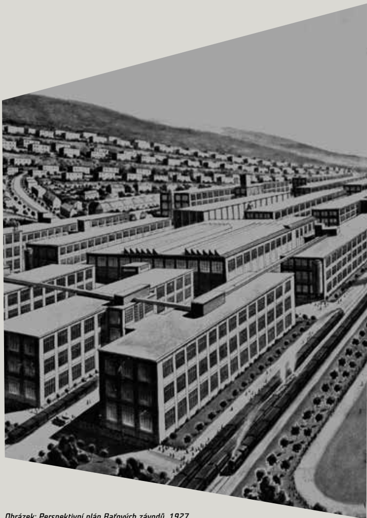
Obrázek: Perspektivní plán Baťových závodů, 1927

Již název komplexu napovídá, že v sobě nese odkaz geniálního podnikatele a ševce Tomáše Bati, který svým umem a hodnotami dobyl svět.